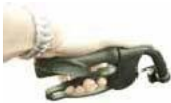
Abb. 8 9